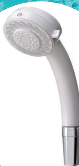
シャワーヘッド本体