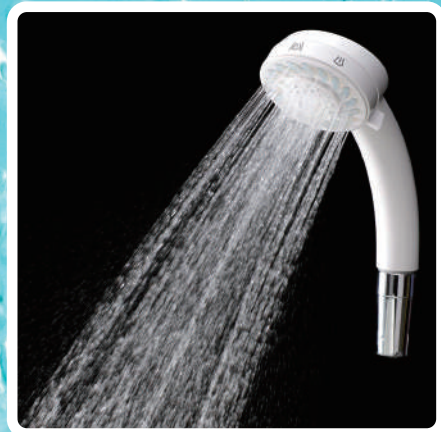
マイクロバブルシャワー