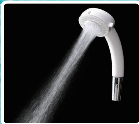
マイクロバブルミストシャワー