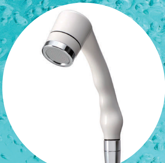
シャワーヘッド本体