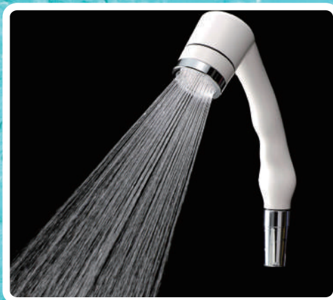
マイクロ・ナノバブルシャワー